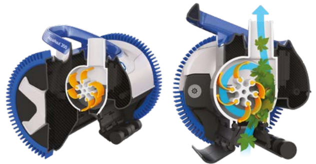
V Flex® turbine à pales mobiles pour capture de gros débris