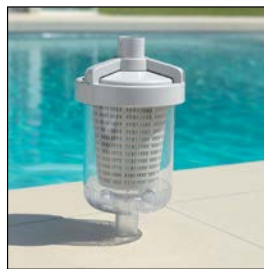
Piège à feuilles